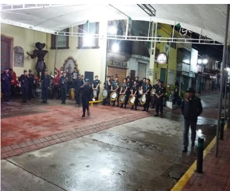
❖ 16 DE SEPTIEMBRE DESFILE CONMEMORATIVO DE LA INDEPENDENCIA.