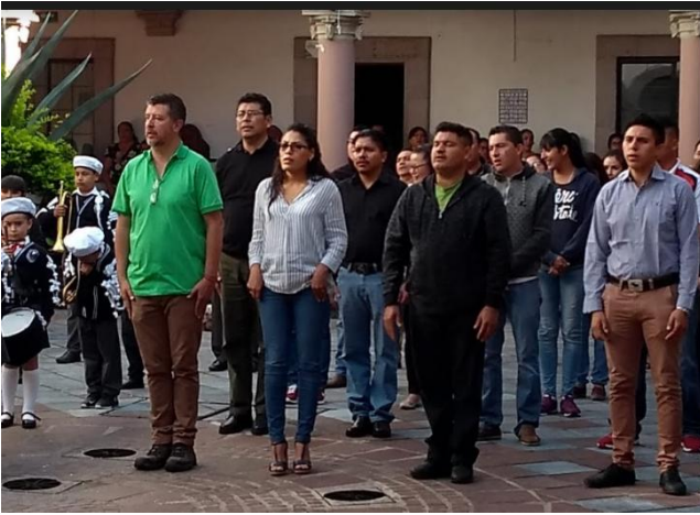
Apoyo a diferentes dependencias.